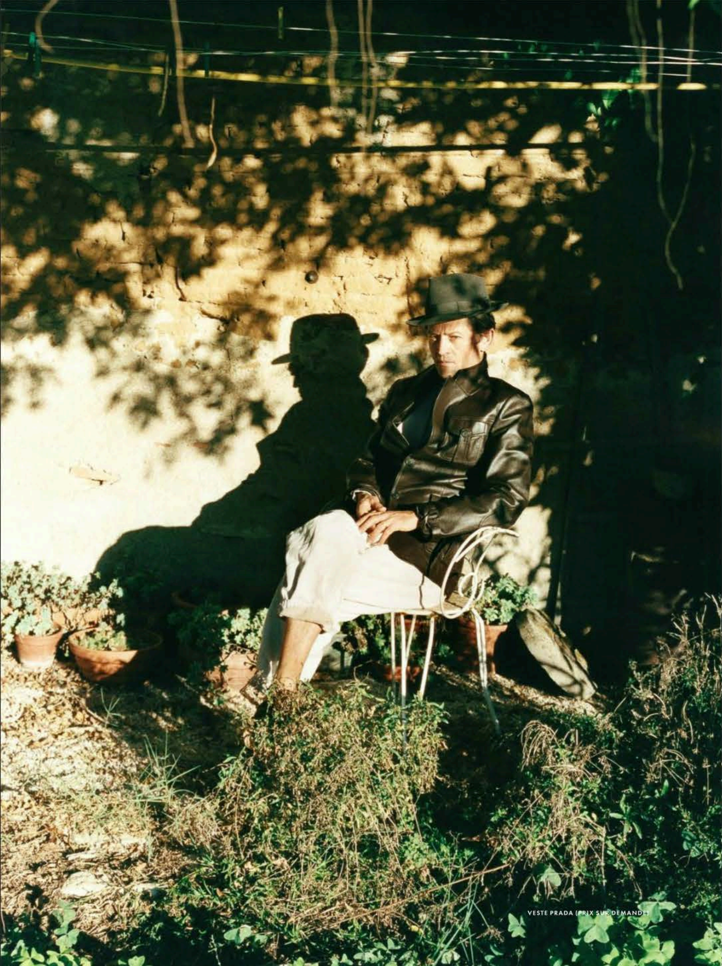
VESTE PRADA (PRIX SUR DEMANDE)