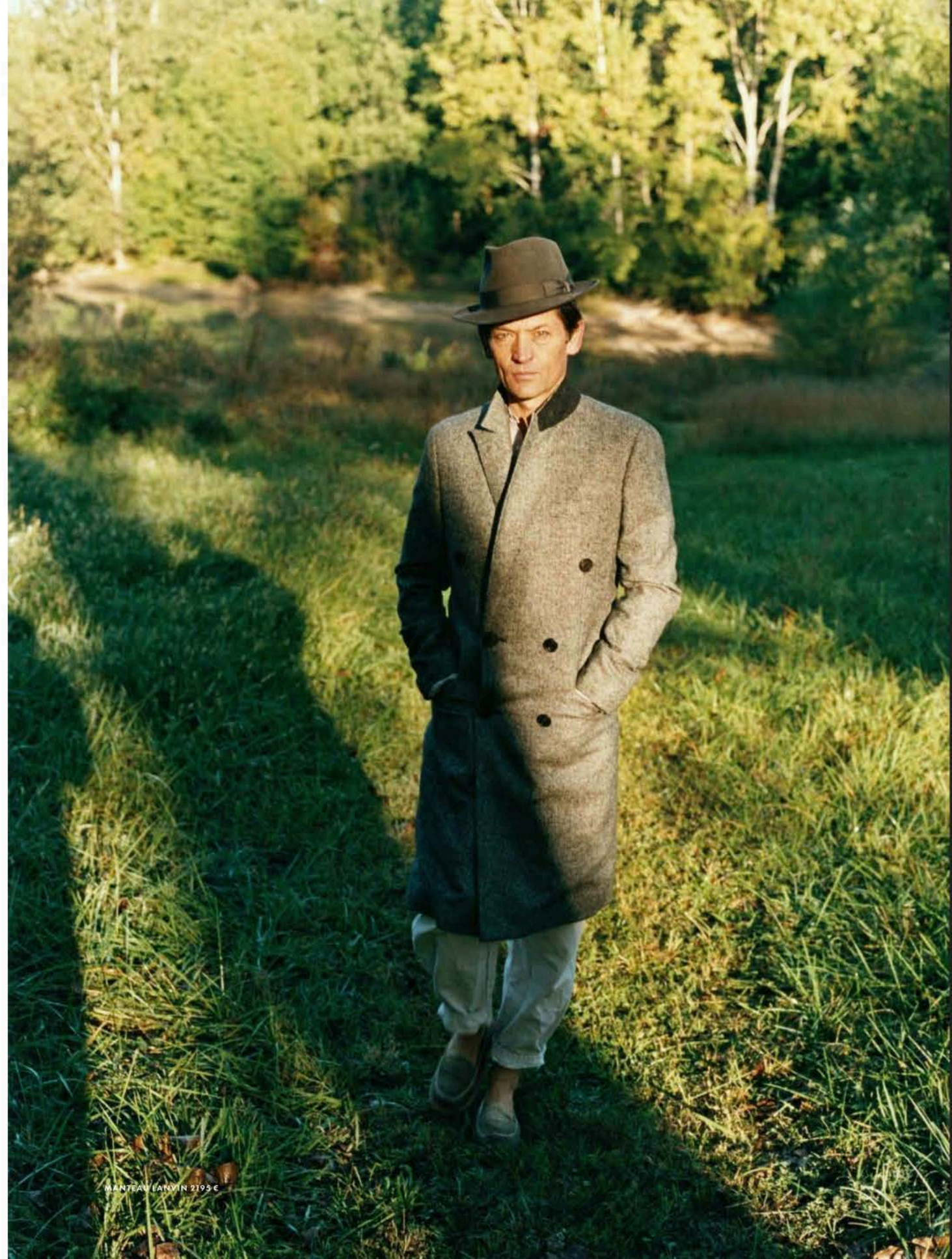
MANTEAU LAMVIN 2193 €